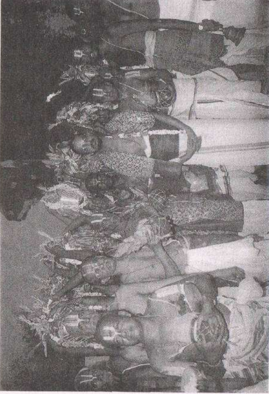
திருஅரிமேய விண்ணகரம் குடமாரும் கூத்தர் ஸம்பரோக்ஷண தினத்தன்று நம் ஸ்வாமிகளுடன் கலா தீர்த்தம் ஏந்திய யஜ்ஞாபதிகள்.