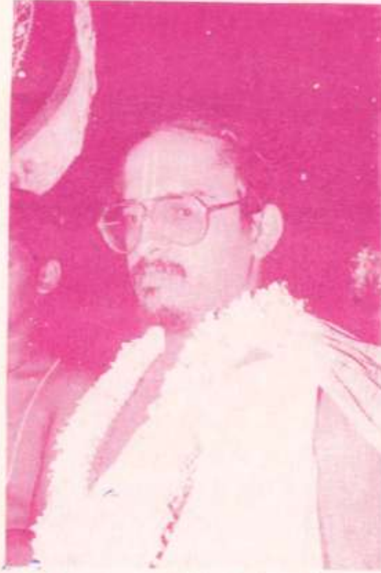
ஸ்ரீ ப்ருந்தாவனத்தில் ஸ்ரீ ஸ்வாமிகள்